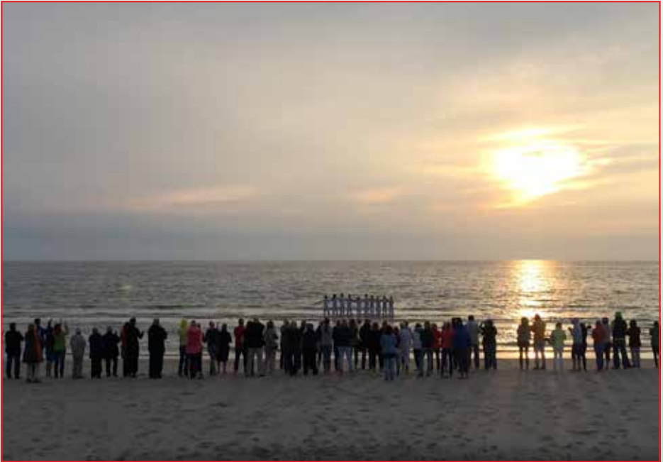
Paluccaschule am Klappholttaler Strand · Foto: Frank Liebscher