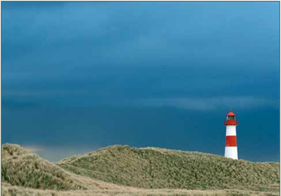
Leuchtturm im Listland